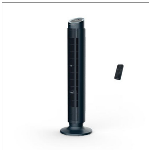
Eole Silence Force, Coluna de Ar, Frescura Intensa, Silenciosa Eole Silence Force, Coluna de Ar, Frescura Intensa, Silenciosa VU7050F0