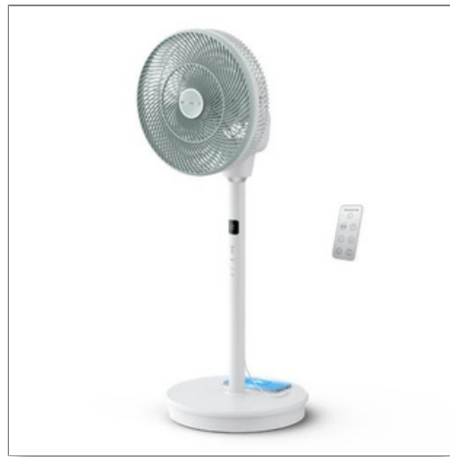
Turbo Silence Compact 3D Nomad Turbo Silence Compact 3D Nomad QV5050F0